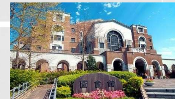
Université Nationale de Taiwan