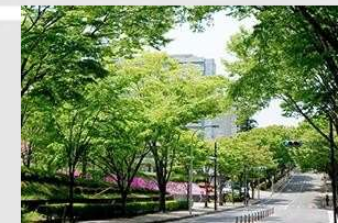
Aobayama Campus Université de Tohoku, Japon