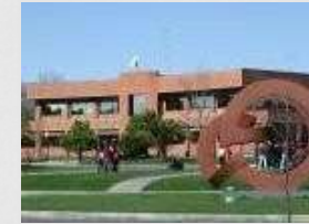
Université de Talca, Chili

TOEFL exigé uniquement pour les universités japonaises et pour l'Université d'Ottawa (Canada)